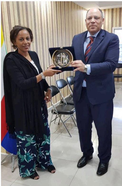
La Directrice de l'ANCI (gauche) et l'Ambassadeur d'Égypte aux Comores. Moroni, Juillet 2019.

L'Ambassadeur du Brésil accrédité aux Comores est venu à Moroni pour présenter ses lettre de créance. Il a profité de son séjour pour faire le suivi avec l'ANCI concernant l'aide mémoire signé entre l'ANCI et l'Agence Brésilienne de Coopération l'année dernière. •