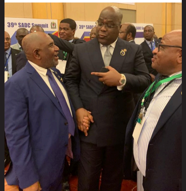
Les Présidents Azali - Comores (gauche) et Tsishekedi - RD Congo (centre), et SEM El Amine Souef, Ministre des Affaires Etrangères des Comores (droite). Dar Es Salaam, 17 août 2019

38 E SOMMET DE LA SADC DAR ES SALAAM, 16-17 AOÛT 2019