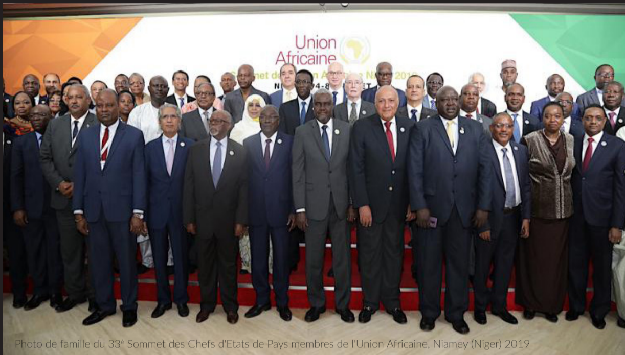
Photo de famille du 33 e Sommet des Chefs d'Etats de Pays membres de l'Union Africaine, Niamey (Niger) 2019

33 E SOMMET DE L'UNION AFRICAINE NIAMEY, 4-8 JUL. 2019