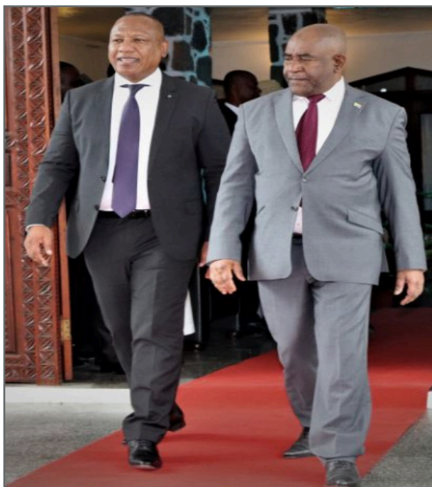
Le Premier ministre malgache Christian Ntsay (gauche) et le Président Azali (droite)

Le Premier Ministre malagasy, qui assumait également l'interim du Ministre des Affaires Etrangères, Christian Ntsay, a réalisé une visite officielle à Moroni en octobre dernier. Il s'agissait d'une visite d'amitié, de fraternité et de respect mutuel entre les Comores et Madagascar.