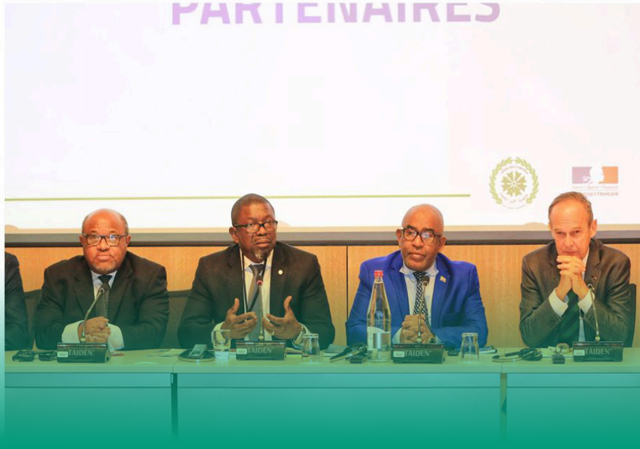
Conférence des Bailleurs à Paris Page 6