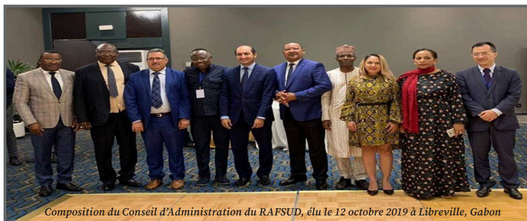
Composition du Conseil d'Administration du RAFSUD, élu le 12 octobre 2019 à Libreville, Gabon

La première Assemblée générale du Réseau des acteurs francophones pour la coopération sud-sud et tripartite (Rafsud) s'est ouverte du 10 au 12 octobre, à Libreville, au Gabon. Co-organisée par le Bureau provisoire du RAFSUD présidé par le Maroc à travers l'Agence marocaine de coopération internationale (AMCI), cette rencontre était placée sous le haut patronage de Julien Nkoghe Bekale, Premier ministre du Gabon.