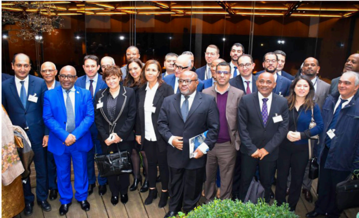
La délégation marocaine menée par le Ministre des Affaires Etrangères Bourita (1 er à gauche), en présence du Président Azali (à gauche, en bleu)