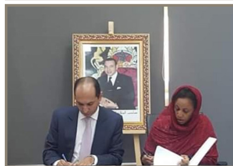
Signature du Plan d'Action commun entre par les directeurs de l'AMCI (gauche) et de l'ANCI (droite), à Libreville, Gabon.